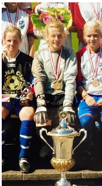
Viktor Gyökeres och Tove Enblom, två spelare fostrade i IFK Aspudden-Tellus, är båda två numer landslagsspelare. Viktor gör succé i Sporting Lissabon medans Tove precis gått till Välerengen. Båda spelarna har varit ruggigt generösa med autografer och selfies till våra unga spelare när det är landslagsmatcher.