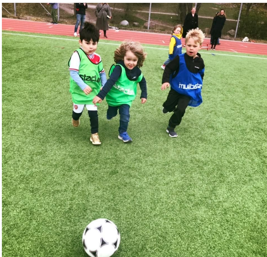
Första träningspasset för PF15 Gul på Västberga. Lek med boll drog som vanligt igång även detta corona-år, med lite anpassningar så vi inte helt fyllde fotbollsplanerna med föräldrar och spelare.