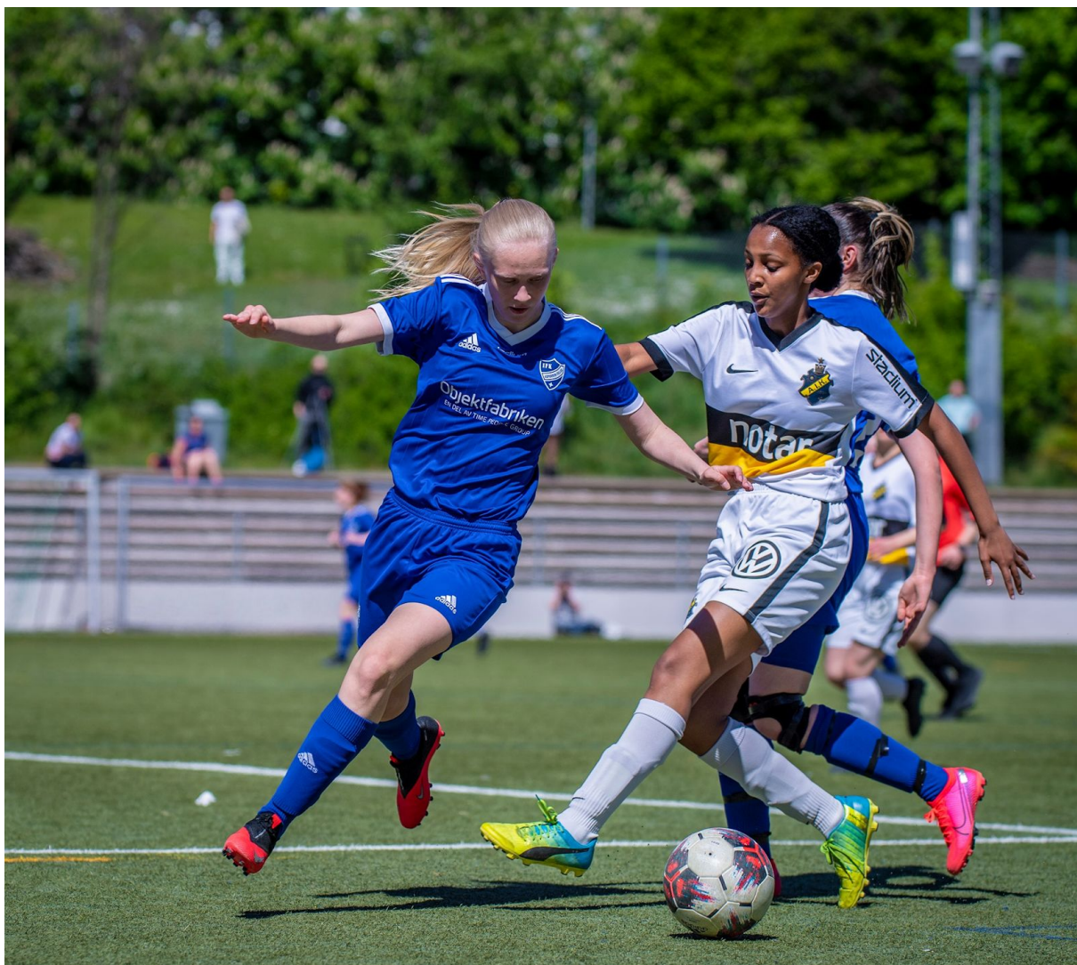
F17 i kamp mot AIK hemma på Linnea.