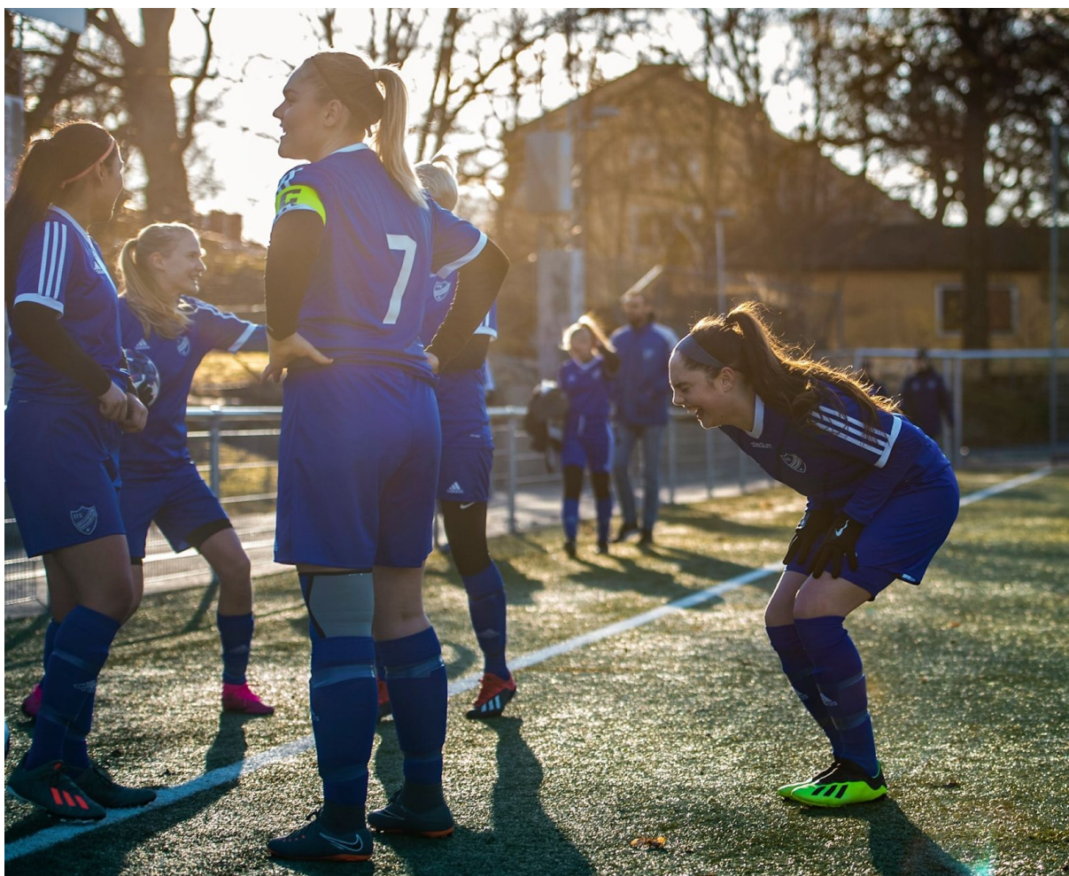
Glädje och gemenskap. Demokrati och delaktighet. Allas rätt att vara med. Rent spel. Några av grundpelarna som klubbens vision & värdegrund bygger på.