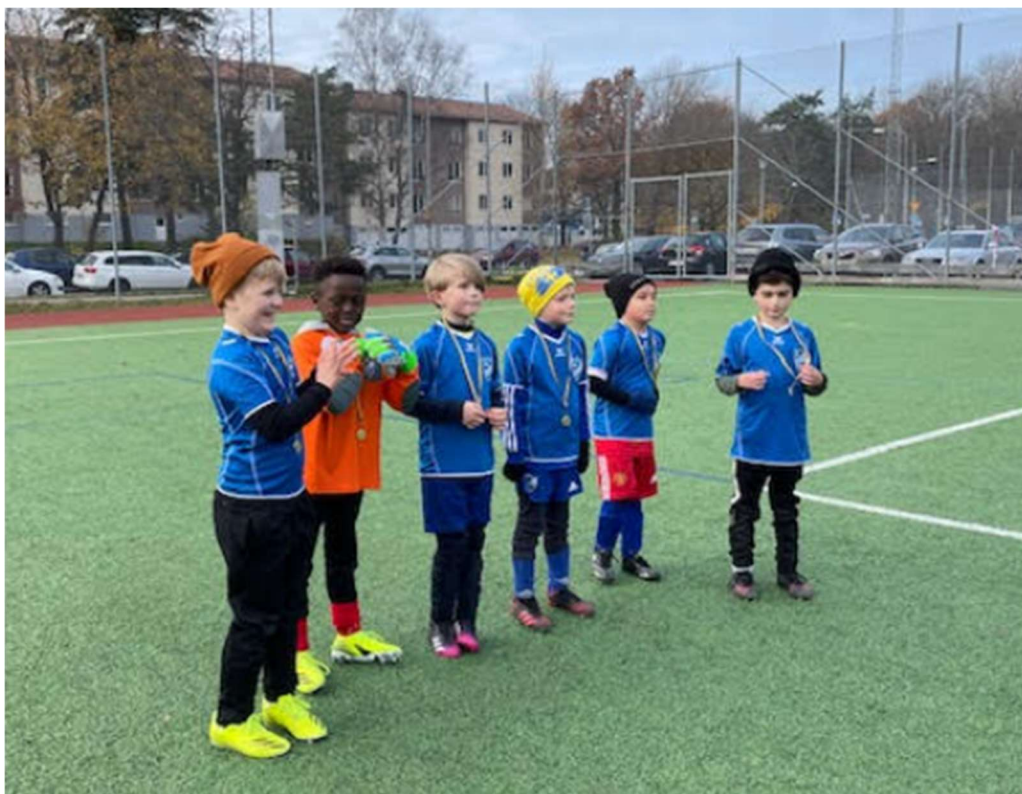
På cup hos Hägersten.

Deltagarna på utomhusträningarna har varit mellan 12 till hela 40 st spelare beroende på väder eller om Sverige har spelat en fotbollsmatch och vunnit. På inomhusträningen har det varit runt 20 st spelare. En del barn dyker upp nästan varje träning medan andra dyker upp lite mer sporadiskt. Vi har fortsatt behålla en blandning av både flickor och pojkar men börjar separera där det har funnits behov av det.