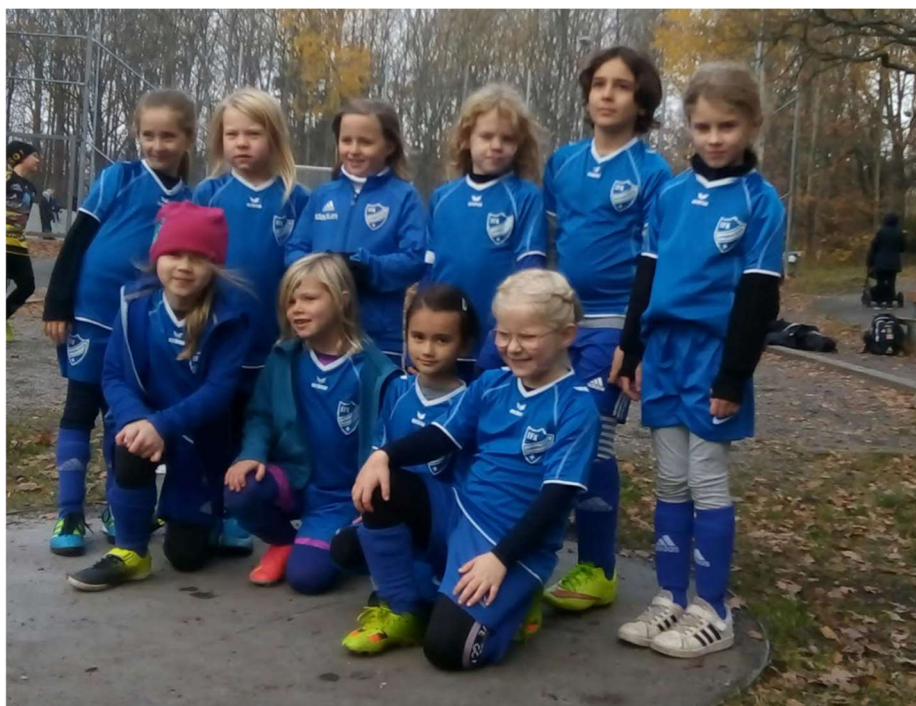
Första matcherna för klubben! Häftig upplevelse.